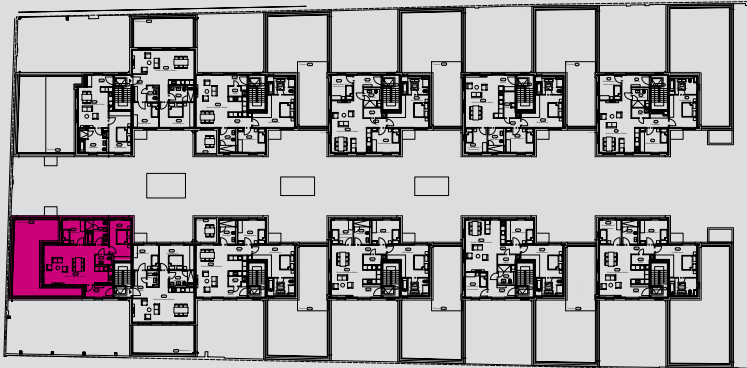
GRUNDRISS 2. OG